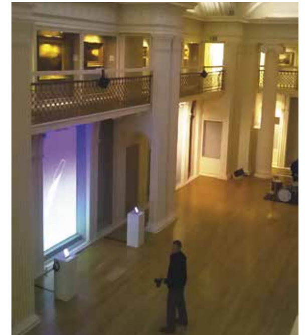
Галерея Эдинбургского университета, названная в честь Тамары и Дэвида

«Скифы» (1957), «Сельджуки в Азии» (1961), «Каждодневная жизнь в Византии» (1967). Тамара также перевела выдающийся труд Михаила Ростовцева, еще одного русского ученого-эмигранта, — «Караванные города». Все эти книги выдержали множество изданий на нескольких языках и продолжают издаваться сегодня в том числе в России.